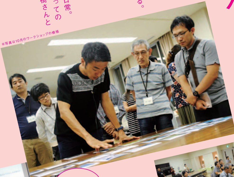
※写真は10月のワークショップの様様