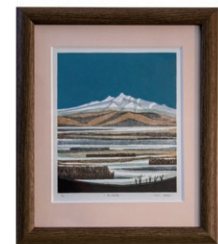
『雪の斜里岳』 大谷一良